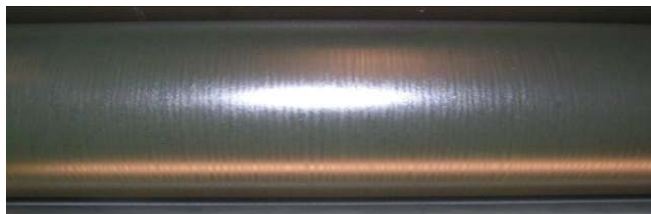
[ 그림1 롤러에 나타난 코딩 모양 ]

이러한 영향들로 인하여 기존의 NBR 습수롤러들은 부풀어 오르는 현상이 나타나는데, 문제는 NBR 고무의 특징으로 표면이 불규칙하게 부풀어 오른다는데 있다. 이것은 일정한 물의 양과 피막을 형성하는데 방해 요소가 된다. 심할 경우 Cording 현상이 발생하여 인쇄물에서의 물 자국 원인이 되기도 하고, 습수롤러의 기능을 급격히 상실하는 원인이 되기도 한다. Cording은 일정한 속도 구간에서만 발생되는데 이 구간을 Cording Window(코딩창)라고 한다. 코딩창은 인쇄업체에서 사용하고 있는 습수액 종류나 작업환경 및 조건에도 영향을 받으므로 업체마다 나타나는 구간에 차이가 발생 할 수 있다.